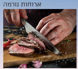
ארוחות גורמה חדרים מפוארים