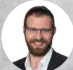
הרב דן טיומקין