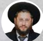
הרב אייל אונגור