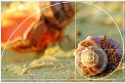
המשך מעמוד <<2

המספרים שמתקבלים בכל שלב (חלקן באופן כתיבת האותיות כפי המובא בספרי קבלה, או בביתא "אותיות דרבי עקיבא" שבהן למשל האות ת' נהגית כ"תאו") תואמים לגמרי למספרי פיבונאצ'י בדילוג על איבר אחד, כלומר איבר כן-איבר לא בסדרה. זאת אומרת, תחילתה של סדרה פיבונאצ'י היא המספרים 1, 2, 3, 5, 8, 13, 21, 34, 55... וכן הלאה, ומילוי האות א' היא הסדרה של כל איבר שני בסדרת פיבונאצ'י: 1, 3, 8, 21, 55... וכן הלאה עד אינסוף. מדובר בפלא בעל שיעור הסתברותי נמוך במיוחד, בפרט לאור העובדה שבכל שלב מצטרפות אותיות חדשות. מתמטיקאי שנדרש לנושא וניסה למצוא את הופעתה של סדרת פיבונאצ'י בשפות נוספות, במטרה להפריך את הפלא, הודה כי ניסה לעשות זאת בשפות נוספות, אך לשווא. "חוץ מהעברית, לא ראיתי עוד את פיבונאצ'י", הודה (במחקר נוסף הוא "הצליח" בדוחק למצוא משהו קרוב בלבד, בשפה אחת ששובשה לצורך הניסיון). לשון הקודש, אם כן, נותרה היחידה שמסדרת בדיוק מופלא עם פיבונאצ'י, כמו שאר חלקי הבריאה. האותיות הנוספות בהן כל איבר שני בסדרת פיבונאצ'י נמצא בהתאמה למספר האותיות בשמות הנפתחים הן האותיות: ה', ל' ו-פ'. הסדרות הנוצרות מהאותיות ה' ו-פ' מתחילות מהאיבר הראשון בסדרת פיבונאצ'י, והסדרות הנוצרות מהאותיות א' ו-ל' מתחילות מהאיבר השני בסדרת פיבונאצ'י. אותן ארבע אותיות, בחילוק ביניהן לפי מיקומן בסדרת פיבונאצ'י, יוצרות את הצירוף המרגש: "א-ל-פ-ה". והאמת היא שגם בלי הוכחות של צירופים נסתרים וצופני סוד אלו, כדי לחוש את נוכחותו של הקדוש ברוך הוא בבריאה, די להסתכל סביבנו ולהתפעם.