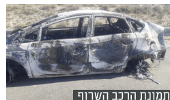
תמונת הרכב השרוף

"לא האמנו להם. אין צורך, תודה, המשטרה בדרך", אמרנו להם. 'אל תחכו למשטרה, אתם לא נורמליים! יהרגו אתכם אתם כאן, תבואו איתנו!' לא הסכמנו. היינו בטוחים שיקחו אותנו לכפר ויפגעו בנו. אבל אז הם אמרו: 'אנחנו נשארים איתכם עד שהמשטרה תבוא. לא ידענו מה לחשוב, אם הם בעד או נגד. תוך כדי שהם משכנעים אותנו, אנחנו המשכנו להתקשר למשטרה, מתחננים שאנחנו מוקפים בערבים. איפה הניידת, איפה!