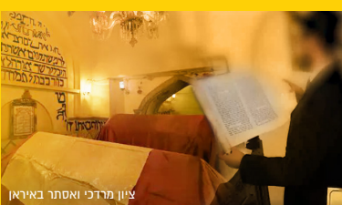
ציון מרדכי ואסתר באיראן