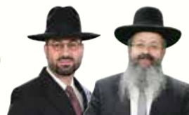
המקובל הרב | רב ראובן זכאים | יצחק בצרי